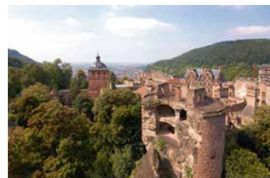
Schloss Heidelberg – der gesprengte Turm