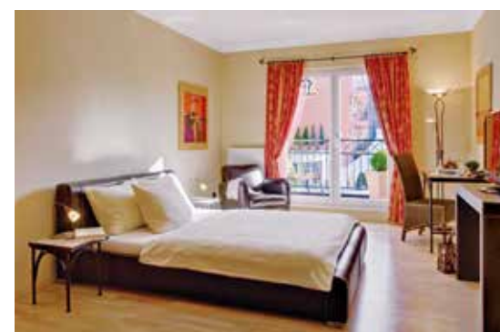
Hotel Villa Toskana, Zimmer Typ Casa Superiore