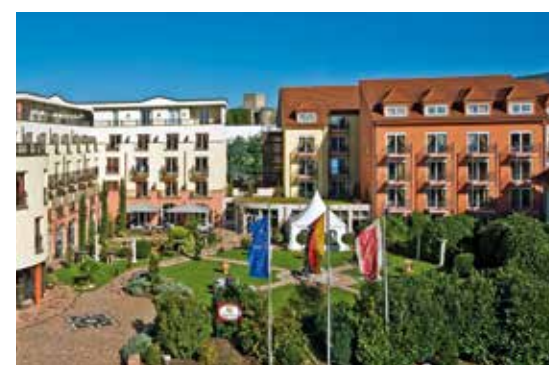
Hotel Villa Toskana